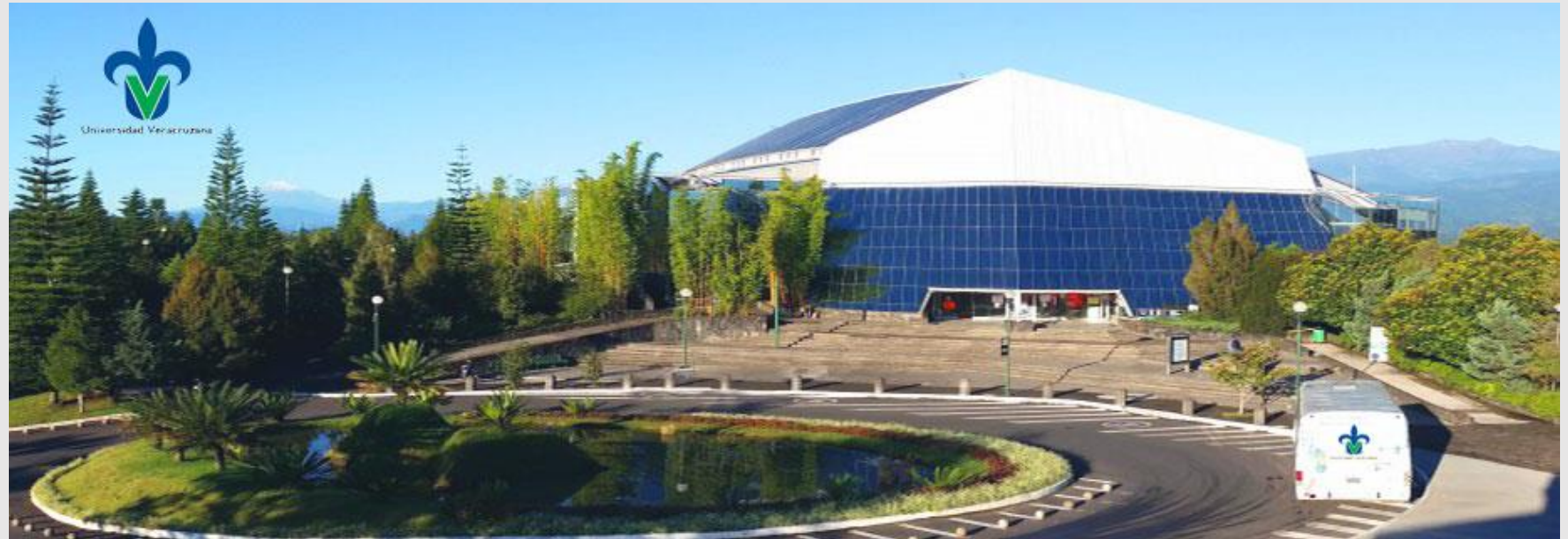
Unidad de Servicios Bibliotecarios y de Información en Xalapa

La infraestructura de la UV comprende 77 facultades, 48 bibliotecas, 45 institutos y centros de investigación, 23 grupos artísticos profesionales, 1 hospital veterinario para grandes especies, 1 Museo de Antropología, 8 talleres libre de arte, 17 centros de idiomas, 6 USBI, 1 Escuela para Estudiantes Extranjeros, 1 casa editorial, 1 clínica universitaria de salud reproductiva y sexual, 1 centro de atención para el cáncer, entre otras instalaciones.